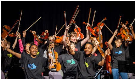
Jóvenes Líderes tocando en Epic Studios en Norwich en 2015.

La Orquesta de Jóvenes Líderes es solo un ejemplo de cómo se puede dar oportunidades a los jóvenes y cómo eso puede ser el mejor rumbo para las organizaciones que quieren construir redes y colaboraciones. Un consejo desde nuestra experiencia: no te enredes creando un plan estratégico perfecto que luego se queda ahí guardado. Toma un salto, y crea algo auténtico, no importa que sea pequeño o aparentemente efímero. Y hazlo junto con los jóvenes a los cuales atiendes.